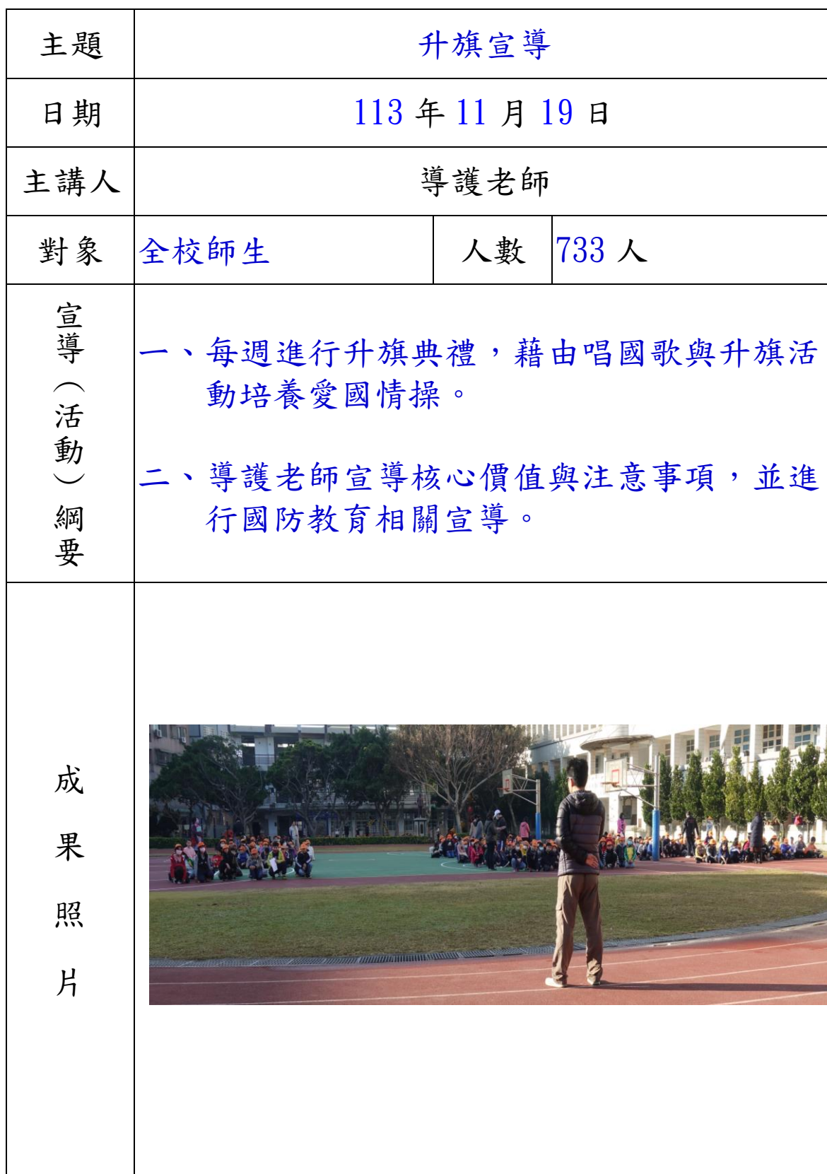
彰化縣新港國民小學 113 年全民國防教育宣導教育活動資料紀錄表

附件二-3 (至少三項活動，一為配合全民國防教育日，一為防空演習，另一為平時宣導)